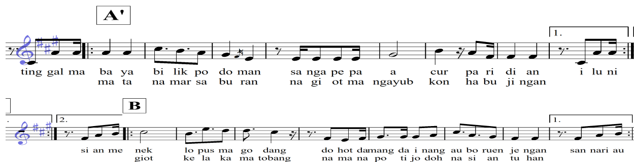
Notasi nomor 1 Bagian vokal A dan B merupakan andung (pantun)

Nyanyian andung dan umut adalah lagu yang sering dinyanyikan ibu untuk menidurkan anaknya, kebudayaan masyarakat Mandailing tersebut diterapkan dalam bentuk syair lagu rere ma na rere yang berbentuk pantun, hal tersebut terdapat pada syair lagu bagian A birama 43-51 dan B birama 71-79 notasi berikut ini.