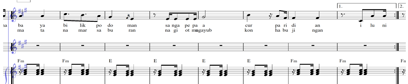
Notasi nomor 4 Progresi akor mixolydian pada seksional A' birama 44-51

Unsur kebudayaan Melayu pada lagu rere ma na rere terlihat pada melodi utama ( contus firmus ) yang terdapat pada bagian penambahan ( auxiliary ) interlude birama 63-70, adapun melodi tersebut dimainkan menggunakan instrumen biola dengan karakter melodi cengkok menggunakan hiasan triller , hal tersebut dapat diamati pada notasi berikut ini.