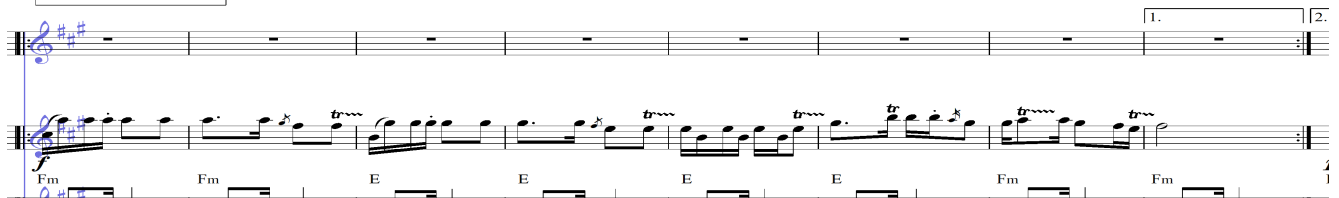
Notasi nomor 5 Karakter Melodi melayu pada birama 63-70