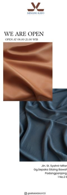
Gambar 3. X-Banner

X-Banner pada Perancangan Ulang Visual Identity PT Minang Kayo berukuran 60 x 160 cm menggunakan tiang X-Banner. Desain Banner menampilkan kalimat sambutan bagi pelanggan dan informasi sedikit tentang PT Minang Kayo tersebut.