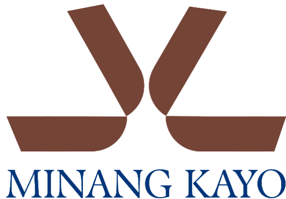
Gambar 1. Logo

Secara keseluruhan logo berupa dua bentuk simetris yang menyerupai huruf “M”, inisial dari Minang. Bentuknya juga dapat diinterpretasikan sebagai dua lembar kulit yang sedang dilipat dan disatukan, melambangkan proses kerajinan tangan, presisi, dan keseimbangan. Bagian bawah yang melebar dan melengkung memberikan kesan kokoh dan stabil, mencerminkan kualitas, daya tahan, serta fondasi kuat dari produk berbahan kulit.