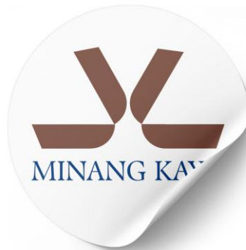
Gambar 5. Sticker