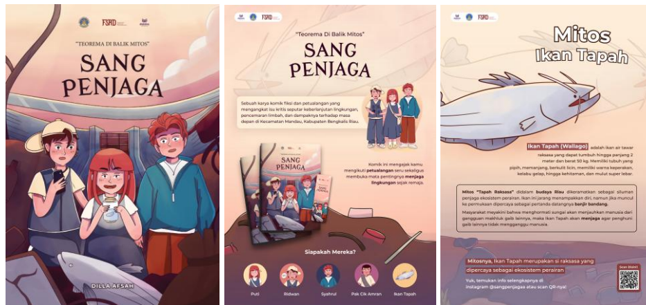
Gambar 4. Media pendukung poster

Ketiga poster tersebut merupakan bauran media yang dirancang sebagai media edukasi kepada khalayak umum namun dengan target audiens terutama remaja usia 13-18, melalui penggunaan warna yang cerah dan berisikan informasi yang memuat tentang perancangan komik. Ketiga poster ini terdiri dari: