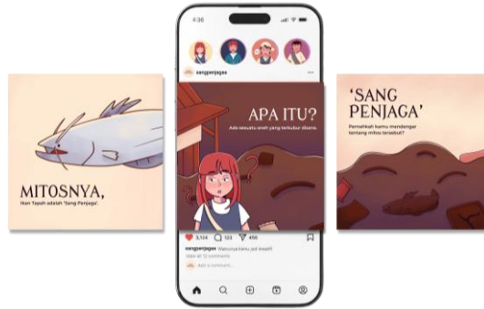
Gambar 3. Media pendukung sosial media

Perancangan media sosial instagram ini terdiri dari 9 postingan yang disusun untuk menyampaikan edukasi lingkungan secara bertahap. Melalui postingan instagram, pesan lingkungan dapat tersampaikan kepada target audiens remaja secara persuasif dan natural, tanpa terkesan menggurui kepada audiens.