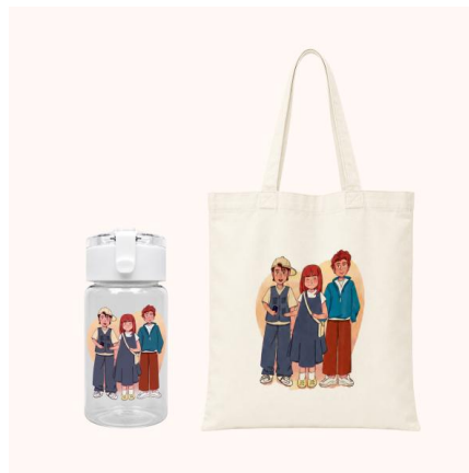
Gambar 10. Tumbler dan totebag

Penggunaan merchandise berupa tumbler dan tote bag berfungsi sebagai media pendukung yang bernilai fungsional sekaligus edukatif. Pemilihan kedua media ini didasari oleh tema utama komik yang mengangkat isu kelestarian lingkungan, sehingga penggunaannya dinilai sangat relevan sebagai aksi nyata dalam mengurangi sampah plastik sekali pakai dan kantong kresek di kalangan remaja.