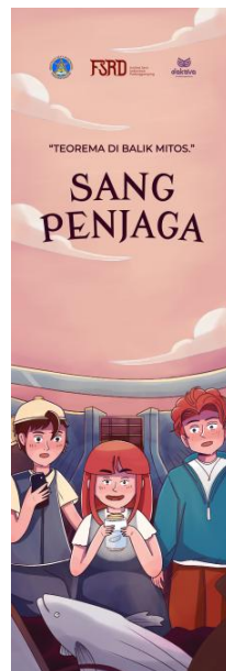
Gambar 8. Bookmark

Bookmark atau pembatas buku ini dirancang dengan ukuran standar 5 x 15 cm agar proporsional saat disisipkan di antara halaman komik, berfungsi sebagai media pendukung fungsional untuk mempermudah pembaca menandai halaman komik Sang Penjaga . Analisis elemen visual menunjukkan konsistensi yang kuat dengan media utama melalui penerapan gaya ilustrasi digital kartun ( cartoon style ).