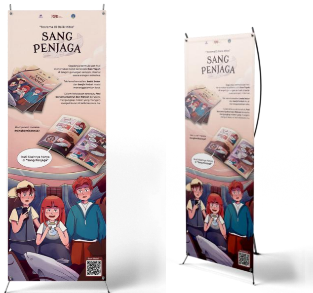
Gambar 6. Media pendukung X-banner

X-banner berfungsi sebagai media pendukung dalam proses launching komik Sang Penjaga. Pada banner terdapat ilustrasi serupa dengan cover komik serta dikombinasikan background berwarna orange, pada bagian atas x-banner terdapat judul bersama tagline serta mock-up bagian depan serta dalam dari komik Sang Penjaga.