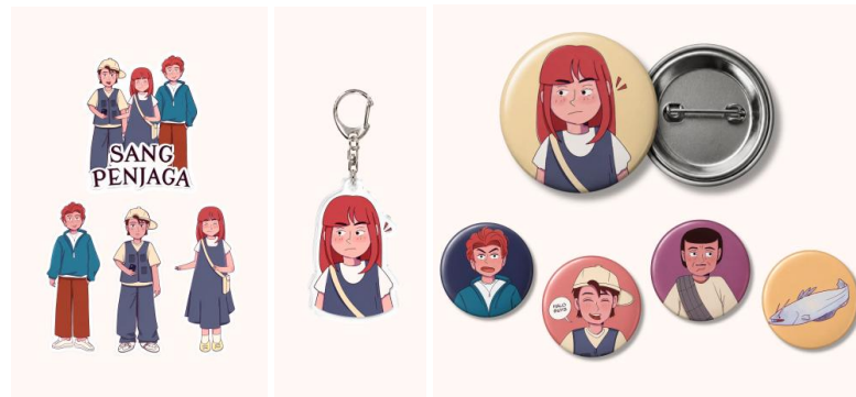
Gambar 9. Stiker, ganci, dan pin

Stiker, pin dan ganci ini dikhususkan untuk menambah ketertarikan para remaja pada komik ini, sekaligus sebagai media promosi yang dibuat menggunakan warna yang cerah dan bahan glossy sehingga membuat tampilannya menjadi jauh lebih menarik. Karakter yang digunakan terdiri dari Puti, Ridwan, Syahrul, Pak Cik Amran, Ikan Tapah dan elemen lainnya sebagai objek tambahan yang menjadi ciri khas dari komik Sang Penjaga.