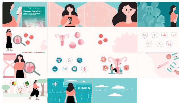
Gambar 1: Cuplikan adegan motion graphic

Motion graphic dalam perancangan ini berfungsi sebagai media informasi mengenai kanker serviks yang ditujukan kepada mahasiswa dan perempuan usia produktif. Media ini menyampaikan informasi mengenai penyebab, faktor risiko, gejala, deteksi dini, vaksinasi HPV, serta langkah pencegahan melalui kombinasi ilustrasi, tipografi, warna, dan audio sehingga pesan dapat disampaikan secara lebih menarik dan mudah dipahami.