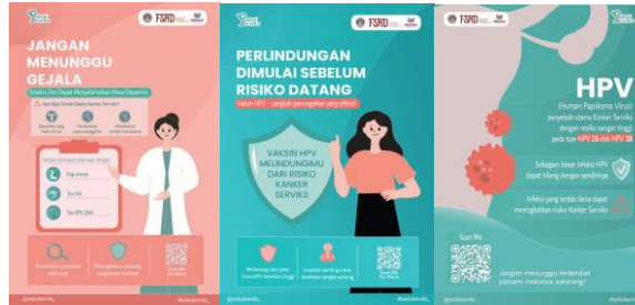
Gambar 3: Poster

Berdasarkan teori media informasi, poster termasuk media visual yang mampu menyampaikan pesan secara cepat dan mudah ditangkap oleh audiens. Informasi yang disampaikan difokuskan pada penyebab dan gejala kanker serviks, pentingnya vaksinasi HPV, dan deteksi dini, sehingga audiens dapat memperoleh gambaran umum mengenai topik yang dibahas tanpa harus membaca informasi yang terlalu panjang.