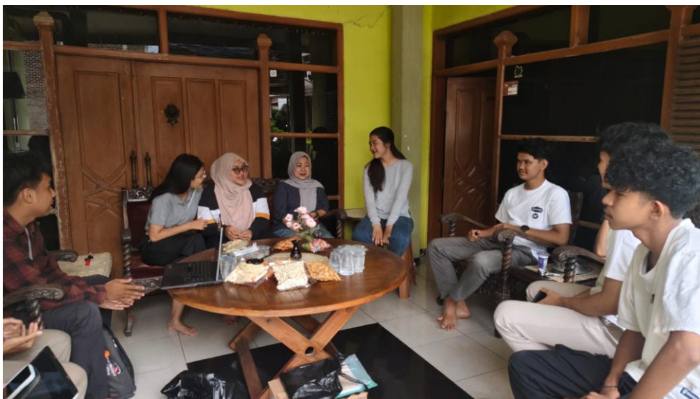
Gambar 3 Pendampingan Komunitas

Pendampingan dilakukan selama 2 kali pertemuan dan selanjutnya pendampingan secara daring, bentuk daripada pendampingan ini dengan membuat konten plan , yang meliputi penentuan tema, membuat jadwal posting, dan pengelolaan akun. Berikut ini beberapa konten hasil pendampingan yang dibuat oleh anggota komunitas.