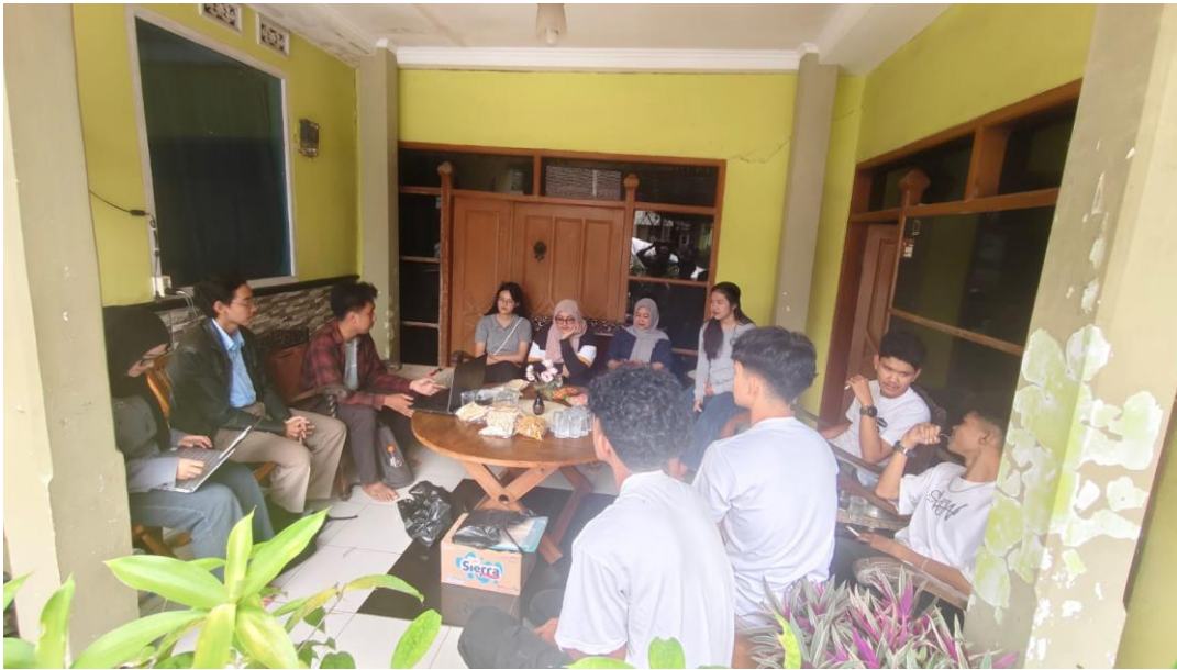
Gambar 1 Pembentukan Komunitas