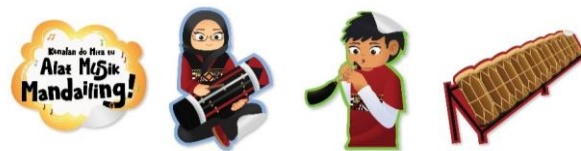
Gambar 6. Stiker

Stiker dirancang sebagai media merchandise yang berfungsi mendukung promosi sekaligus memperkuat identitas visual buku ilustrasi Kenalan do Hita tu Alat Musik Mandailing! . Visual yang digunakan mengadaptasi ilustrasi karakter dan alat musik tradisional Mandailing yang terdapat di dalam buku, sehingga tercipta keterkaitan yang konsisten antara media utama dan media pendukung. Stiker dicetak berukuran 5 \times 5 cm menggunakan bahan maxdecal yang memiliki ketahanan baik, tidak mudah sobek, dan tahan terhadap air.