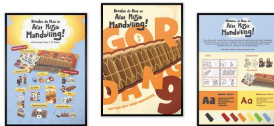
Gambar 3. Poster

Poster dirancang sebagai media pendukung untuk memperkenalkan buku ilustrasi tentang alat musik tradisional Mandailing kepada anak-anak dan masyarakat umum. Visual poster menggunakan ilustrasi bergaya kartun dengan warna yang cerah agar sesuai dengan karakteristik target audiens. Poster dicetak berukuran A2 (42 × 60 cm) pada kertas luster untuk menghasilkan kualitas warna yang lebih baik dan ditempatkan pada lokasi strategis, seperti sekolah, perpustakaan, dan area pameran, guna memperluas jangkauan informasi.