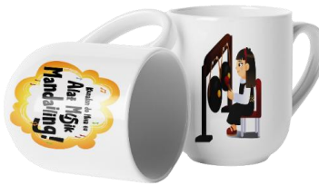
Gambar 8. Mug

Mug disiapkan sebagai media pendukung untuk mendukung promosi buku ilustrasi Kenalan do Hita tu Alat Musik Mandailing!. Pemilihan mug didasarkan pada kegunaannya dalam aktivitas sehari-hari, sehingga memungkinkan interaksi yang lebih lama antara audiens dan karya. Visual pada mug memadukan judul buku dengan salah satu karakter ilustrasi yang muncul dalam buku.