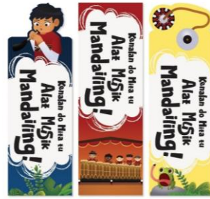
Gambar 5. Bookmark