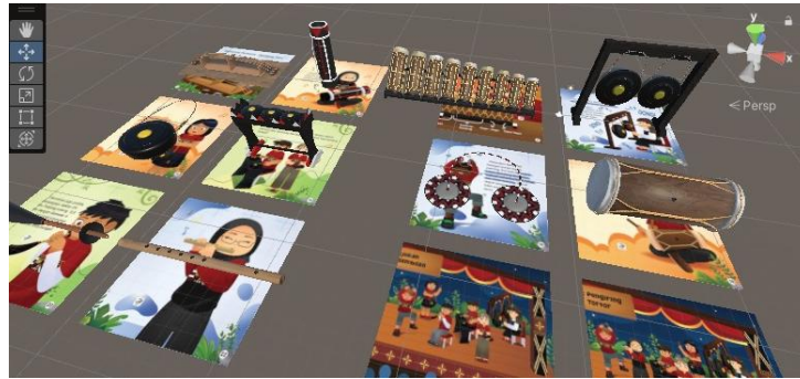
Gambar 2. Augmented Reality