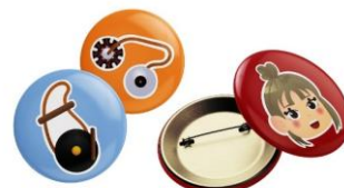
Gambar 7. Pin

Pin dibuat sebagai media pendukung untuk memperkenalkan buku ilustrasi Kenalan do Hita tu Alat Musik Mandailing! kepada masyarakat, terutama anak-anak. Pilihan pin didasarkan pada kepraktisan dan kemudahannya dibawa, serta daya pakainya yang tahan lama. Pin dicetak berdiameter 44 mm dengan lapisan laminasi doff.