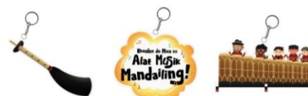
Gambar 7. Gantungan Kunci

Gantungan kunci merupakan merchandise yang menjadi salah satu media pendukung untuk melengkapi buku ilustrasi tentang alat musik tradisional Mandailing. Setiap gantungan kunci berukuran 5 \times 7 cm dan hadir dalam tiga variasi desain ilustrasi.