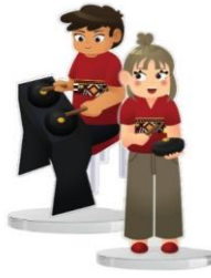
Gambar 8. Standee Akrilik