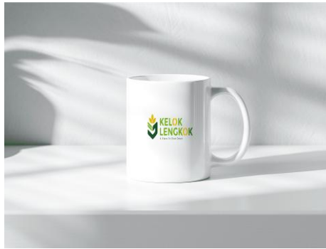
Gambar 10. Mug Kelok Lengkok

Desain mug menggunakan logo Kelok Lengkok untuk memperkuat karakter visual dan meningkatkan daya ingat audiens terhadap Kelok Lengkok