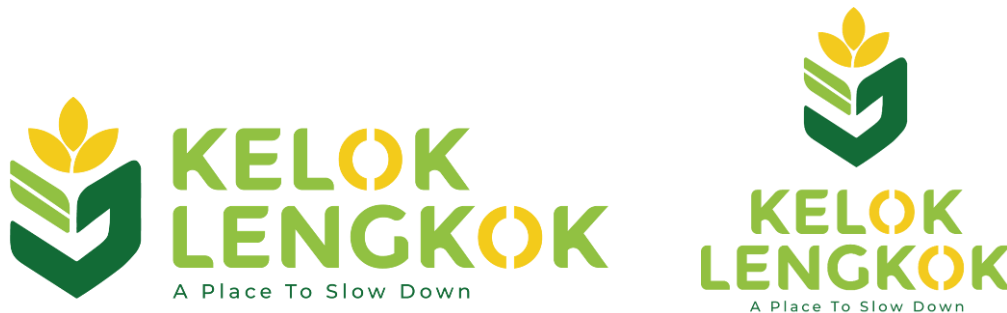
Gambar 3. Logo Kelok Lengkok

Elemen daun melambangkan alam, kesejukan, dan lingkungan yang asri. Penggunaan bentuk daun bertujuan memperkuat identitas wisata alam serta mencerminkan suasana tenang. Bagian tengah logogram membentuk garis kelok menyerupai huruf “V” yang terinspirasi dari bentuk jalan berkelok pada kawasan Kelok Lengkok, Bentuk ini juga memberikan kesan harmonis dan menjadi elemen utama yang memperkuat karakter visual logo. Dua garis horizontal pada bagian bawah logo merepresentasikan hamparan sawah dan bentang alam yang luas. Selain itu, kedua garis tersebut memberikan kesan tenang, stabil, dan seimbang sehingga mendukung karakter wisata sebagai tempat untuk bersantai dan menikmati suasana alam