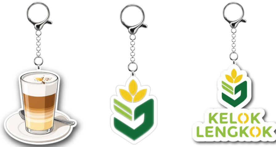
Gambar 13. Keychain Kelok Lengkok

Keychain dirancang menggunakan logo Kelok Lengkok yang dipadukan dengan wordmark dan ilustrasi Teh Talua sebagai representasi identitas destinasi dalam gaya vektor.