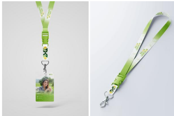
Gambar 8. Id Card dan Lanyard Kelok Lengkok

Desain Id Card Kelok Lengkok menggunakan foto, logo Kelok Lengkok pada bagian atas, serta pattern. Sementara itu, desain lanyard menggunakan warna yang sesuai dengan identitas visual Kelok Lengkok dan dilengkapi dengan pattern logo serta tagline "A Place to Slow Down".