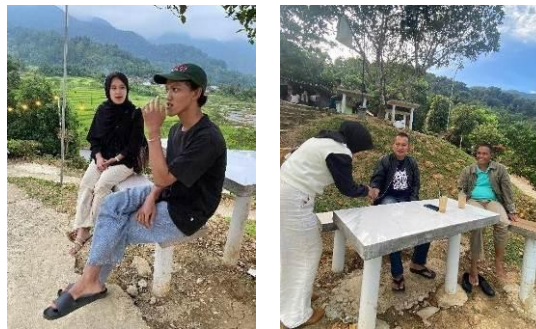
Gambar 1. Wawancara Bersama pengelola dan pengunjung Kelok Lengkok

Wawancara dilakukan dengan pihak pengelola wisata sebagai narasumber utama dalam memperoleh informasi yang lebih mendalam. Informasi yang diperoleh meliputi perkembangan jumlah kunjungan wisatawan, upaya yang telah dilakukan, serta harapan pengelola terhadap pengembangan wisata kedepan. Hasil wawancara ini menjadi salah satu sumber data utama dalam memahami permasalahan yang terjadi. Kemudian wawancara dilanjutkan kepada beberapa pengunjung yang sedang berada di lokasi dengan kriteria sesuai dengan target audiens. Data yang dikumpulkan meliputi sumber informasi yang digunakan untuk mengetahui lokasi wisata, alasan berkunjung, pengalaman selama berada di lokasi serta penilaian terhadap fasilitas yang tersedia. Selain itu wawancara bertujuan untuk menggali pendapat pengunjung terkait jenis media promosi yang dinilai paling efektif untuk mendukung pengembangan promosi kedepan.