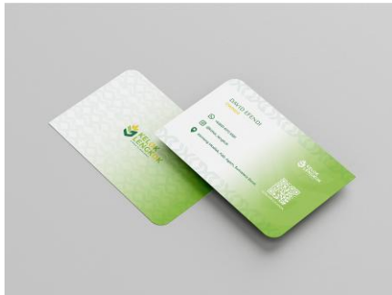
Gambar 7. Kartu Nama Kelok Lengkok

Pada desain kartu nama Kelok Lengkok, bagian depan menampilkan informasi kontak, lokasi, dan kode QR, sedangkan bagian belakang menampilkan logo Kelok Lengkok dan pattern sebagai identitas visual destinasi.