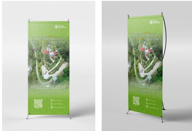
Gambar 5. X banner Kelok Lengkok

Dalam banner Kelok Lengkok, headline “A place to relax, unwind, and reconnect with nature around you” digunakan sebagai elemen utama menarik perhatian audiens. Headline tersebut bertujuan menyampaikan pesan bahwa kelok lengkok merupakan tempat yang cocok untuk bersantai, melepaskan penat dan menikmati kembali kedekatan dengan alam. Penggunaan ukuran teks yang besar serta penekanan warna pada kata Relax dan Nature membuat headline lebih menonjol sehingga mudah menarik perhatian audiens. Selain itu, visual foto udara (drone) yang menampilkan keindahan kawasan Kelok Lengkok turut memperkuat daya tarik banner karena memberikan gambaran langsung keindahan alam Kelok Lengkok. Pada bagian bawah banner juga terdapat QR code , informasi media sosial, kontak dan lokasi yang berfungsi sebagai call to action kepada audiens untuk mencari informasi lebih lanjut dan berkunjung Ke Wisata Alam Kelok Lengkok.