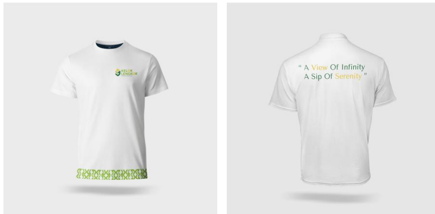
Gambar 11. T-shirt Kelok Lengkok

Pada bagian depan desain T-shirt terdapat logo Kelok Lengkok, sedangkan pada bagian belakang terdapat headline "A View of Infinity, A Sip of Serenity" serta pattern yang diadaptasi dari identitas visual Kelok Lengkok. Elemen-elemen tersebut bertujuan memperkuat promosi, meningkatkan brand awareness , dan mempertegas karakter visual Kelok Lengkok