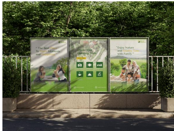
Gambar 4. Poster Kelok Lengkok