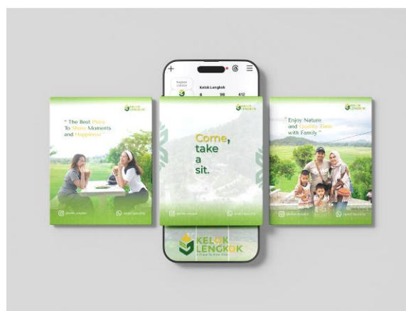
Gambar 6. Feed instagram Kelok Lengkok

Media sosial berperan penting dalam penyebaran informasi dan promosi Wisata Alam Kelok Lengkok. Oleh karena itu, dirancang media promosi yang informatif, menarik, dan strategis untuk meningkatkan awareness. Desain diarahkan untuk mengajak audiens mengunjungi akun media sosial serta melihat video promosi yang telah dipublikasikan. Konten visual menggunakan ilustrasi pengalaman berwisata, elemen logo, headline , dan subline dengan pendekatan emosional untuk membangun kedekatan serta memperkuat identitas Wisata Alam Kelok Lengkok di berbagai media.