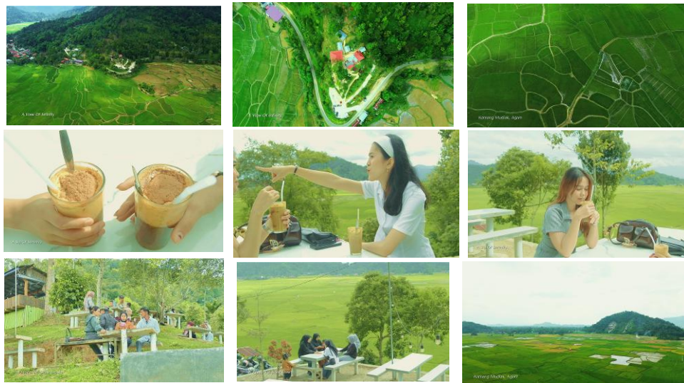
Gambar 2. Video Promosi Kelok Lengkok

Media utama yang dirancang adalah video promosi Wisata Alam Kelok Lengkok berdurasi sekitar 3 menit 5 detik yang menampilkan keindahan alam sebagai daya tarik utama, sekaligus menggambarkan pengalaman berkunjung, fasilitas, serta aktivitas yang dapat dilakukan di Kelok Lengkok. Video ini menggabungkan gambar bergerak, suara, teks, dan narasi untuk menyampaikan informasi secara lebih efektif dan mudah dipahami oleh audiens. Dalam teori komunikasi visual, media audio visual mampu menyampaikan pesan melalui kombinasi elemen tersebut sehingga lebih efektif dibandingkan media visual diam atau media non-bergerak. Video ini juga menerapkan prinsip Desain Komunikasi Visual, yaitu: