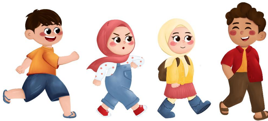
Gambar 4. Pion Karakter “BERANI PILIH”