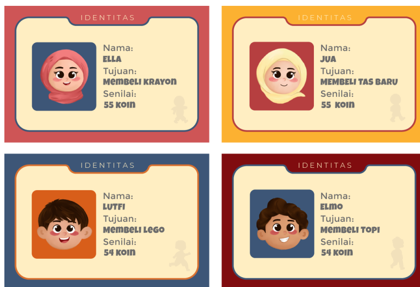
Gambar 5. Kartu Identitas “BERANI PILIH”

Kartu identitas berfungsi sebagai media pendukung yang memperkuat peran karakter sekaligus menyampaikan tujuan finansial yang harus dicapai pemain selama permainan berlangsung. Pada setiap kartu terdapat ilustrasi karakter, nama karakter, serta target keinginan yang ingin diwujudkan beserta nominal koin yang dibutuhkan. Melalui kartu ini, pemain diperkenalkan pada konsep bahwa setiap individu memiliki tujuan dan kebutuhan yang berbeda sehingga diperlukan perencanaan dan pengelolaan uang yang tepat untuk mencapainya. Selain memperjelas tujuan permainan, kartu identitas juga membantu menanamkan pemahaman mengenai pentingnya menentukan prioritas, membuat perencanaan sederhana, serta berusaha mencapai tujuan melalui pengelolaan uang saku yang bijak.