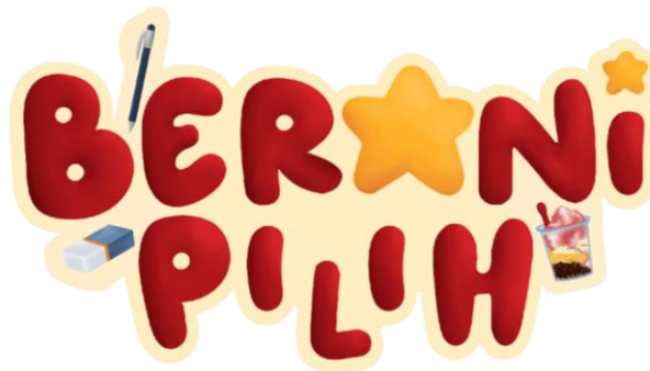
Gambar 1. Logo Board game "BERANI PILIH"

Logo "BERANI PILIH" dirancang sebagai identitas visual utama board game edukasi tentang manajemen uang saku untuk anak usia 8–10 tahun. Logo menggunakan pendekatan logotype yang dipadukan dengan elemen ilustratif untuk menciptakan kesan yang menyenangkan, ramah anak, dan sesuai dengan karakter permainan. Tipografi yang digunakan memiliki bentuk tebal, playful , dan mudah dibaca sehingga mampu menarik perhatian target audiens sekaligus memperkuat keterbacaan identitas permainan. Penggunaan warna merah sebagai warna dominan merepresentasikan keberanian dalam mengambil keputusan, khususnya dalam mengelola uang saku dan menentukan prioritas. Sementara itu, ilustrasi pendukung yang mengelilingi tipografi dirancang menggunakan gaya visual yang konsisten dengan elemen board game lainnya sehingga menciptakan kesatuan identitas visual. Secara keseluruhan, logo dirancang untuk merepresentasikan nilai edukatif, interaktif, dan menyenangkan yang menjadi karakter utama board game "BERANI PILIH".