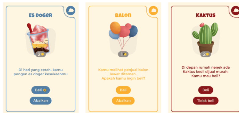
Gambar 3. Kartu Kejadian "BERANI PILIH"

Kartu kejadian berfungsi sebagai media penyampaian materi edukasi sekaligus elemen yang memperkaya variasi permainan. Kartu ini menghadirkan berbagai situasi sederhana yang berkaitan dengan penggunaan uang saku sehingga pemain dituntut untuk mengambil keputusan dan menentukan prioritas. Kartu kejadian dibagi menjadi tiga kategori berdasarkan zona permainan, yaitu kartu biru, kuning, dan merah. Pembagian tersebut bertujuan menyesuaikan tingkat tantangan dan konteks peristiwa yang dialami pemain selama permainan berlangsung. Melalui simulasi yang dekat dengan kehidupan sehari-hari, kartu kejadian membantu anak memahami konsep kebutuhan, keinginan, menabung, serta konsekuensi dari keputusan finansial secara sederhana dan menyenangkan.