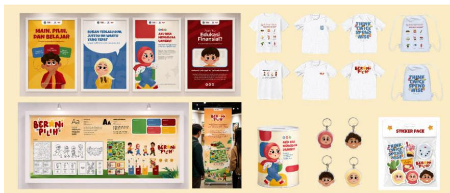
Gambar 7. Media Bauran

Poster dan banner berperan sebagai media informasi dan promosi yang memperkenalkan board game kepada audiens, sedangkan visual moodboard digunakan untuk menampilkan proses perancangan serta pengembangan identitas visual karya. Sementara itu, merchandise seperti kaos, celengan, stiker, keychain, dan string bag dirancang untuk memperluas interaksi audiens dengan media edukasi yang dibuat. Dengan demikian, media bauran tidak hanya berfungsi sebagai pelengkap visual, tetapi juga menjadi bagian dari strategi komunikasi yang mendukung penyebaran pesan edukasi serta memperkuat pengalaman audiens terhadap board game "BERANI PILIH".