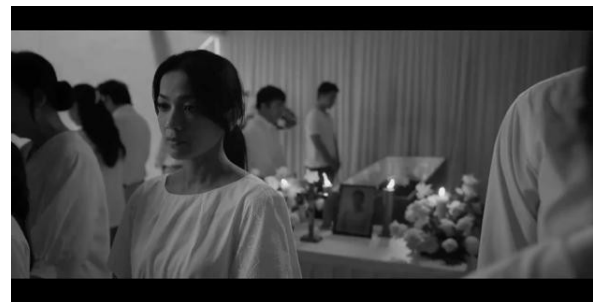
Gambar 2. Scene 29 int.rumah duka Timecode (00.34.48-00.35.47)