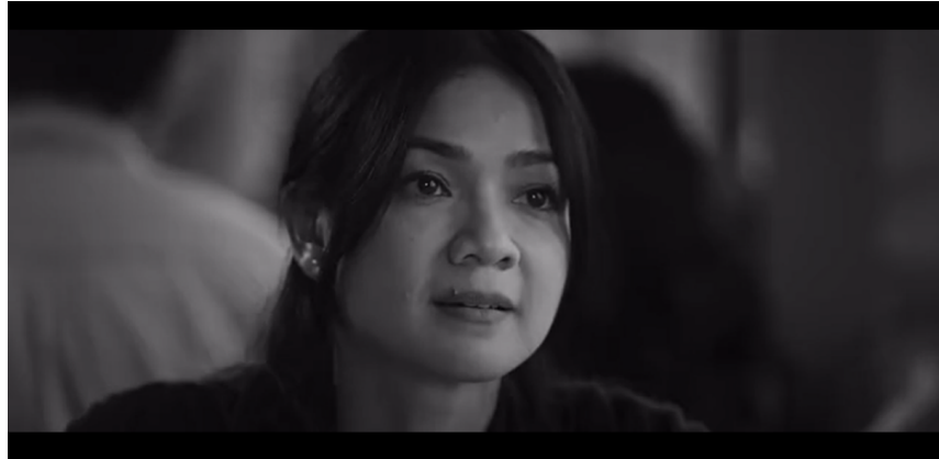
Gambar 3. Scene 36 int.tempat makan Timecode (00.45.25-00.46.33)