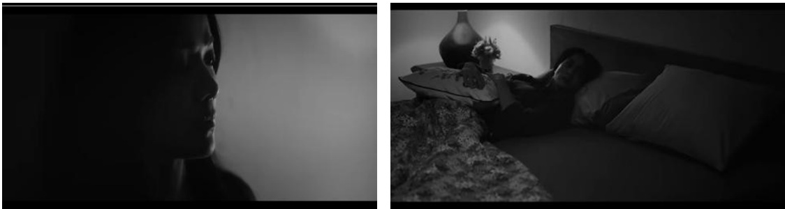
Gambar 4. Scene 71 dan 73 int.kamar hana Timecode (01.10.54-01.13.08)