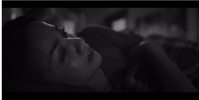
Gambar 1. Scene 28 dan 30 int.ruang tamu Hana Timecode (00.34.32-00.35.47)