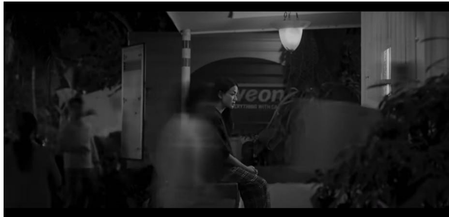
Gambar 5. Scene 102 ext. Rumah Hana