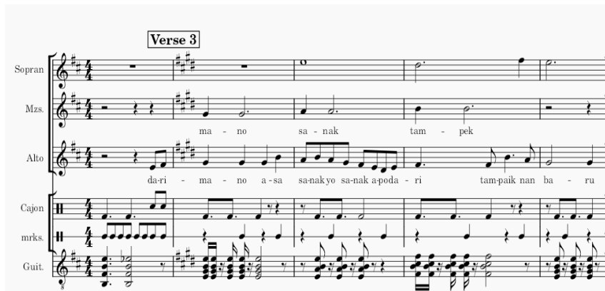
[Gambar 4. Bagian Bait 3]