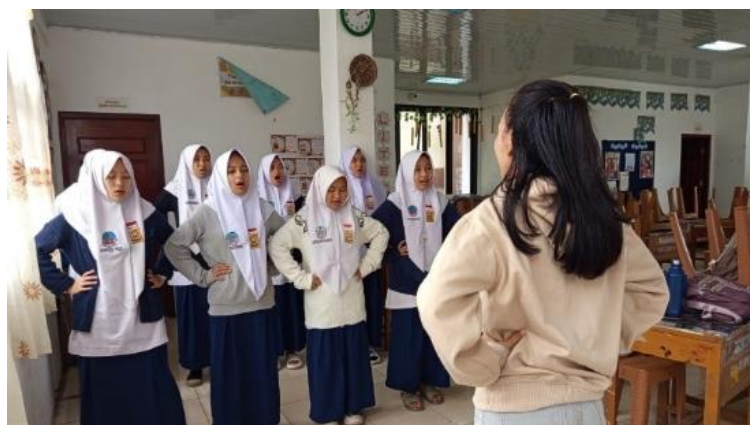
[Gambar 5. Proses pemanasan diafragma dengan vokal "Ma"]